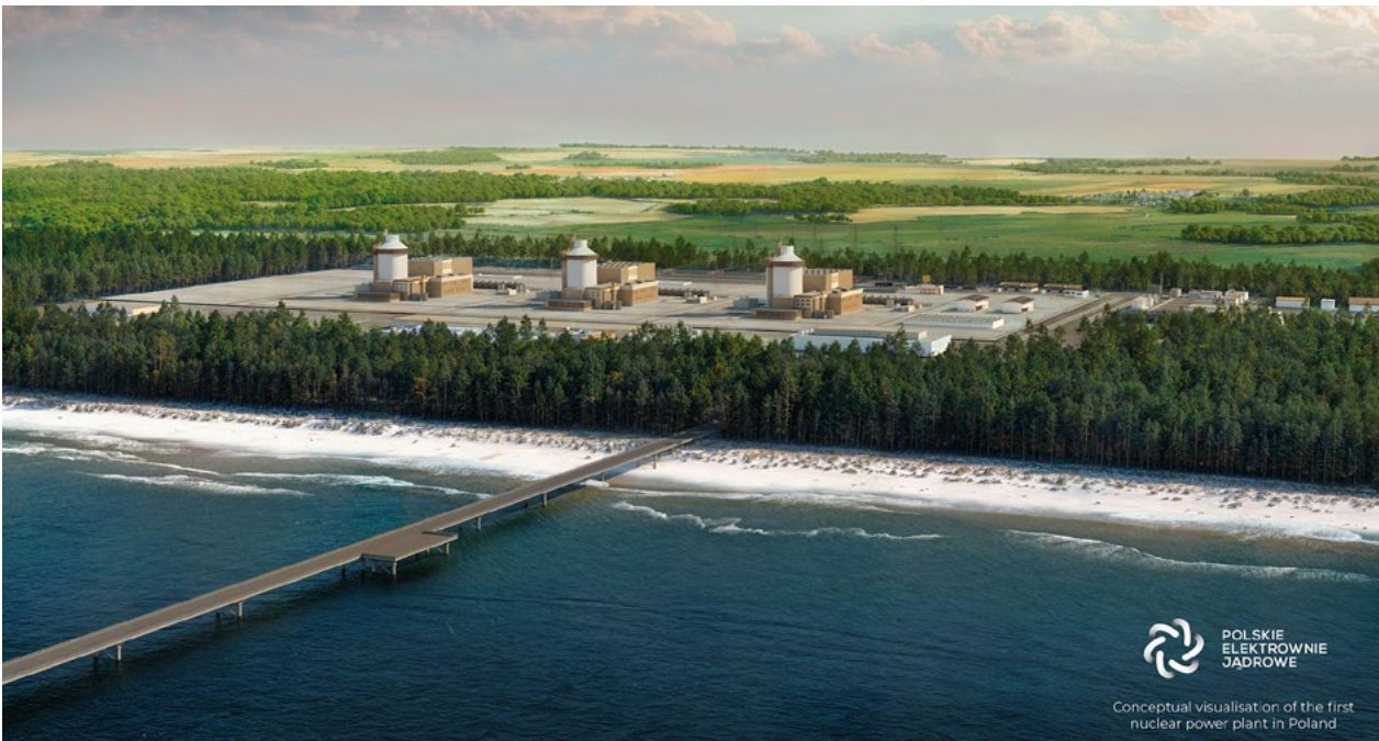
Kernkraftwerk Lubiatowo-Kopalino, Darstellung.

technischen Arbeitsschritte aufzuzeigen, mit denen ein Wiedereinstieg in die Kernenergie in Deutschland organisiert werden kann.