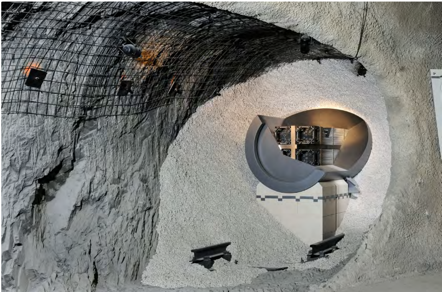
Einlagerungsmodell Mont Teri (Comet Photoshopping GmbH).

Eine maximale Intransparenz ist im Hinblick auf den bisherigen Verlauf des Standortauswahlverfahrens festzustellen. Das macht sich fest an dem Fehlen von vorlaufenden Hinweisen zu der Aufgabe von Gorleben, die zudem bis heute nicht einem öffentlichen Diskurs unterzogen wurde, der Ausweitung der „geeigneten“ Teilgebiete, die nicht auf standortbezogenen, sondern auf Referenzdaten beruht und einem erhöhten Zeitbedarf, der noch ein Jahr vor Veröffentlichung abgestritten wurde und der von keiner am Verfahren beteiligten Institution angemessen thematisiert wurde. Dies lässt sich wohl nur damit erklären, dass die Organisationen ausschließlich ein Insihgeschäft betrieben haben. Diese Erkenntnis muss bei der zukünftigen Organisation der Endlagerung Berücksichtigung finden.