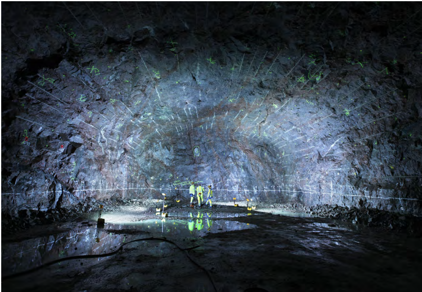
Untergrundlabor Aspö, Schweden.

Diese Vorgehensweise führte zu der inakzeptabel hohen Anzahl von „geeigneten“ Teilgebieten, was im Hinblick auf den Auswahlprozess zu keiner Einengung und auch zu keinem Erkenntnisgewinn führt.