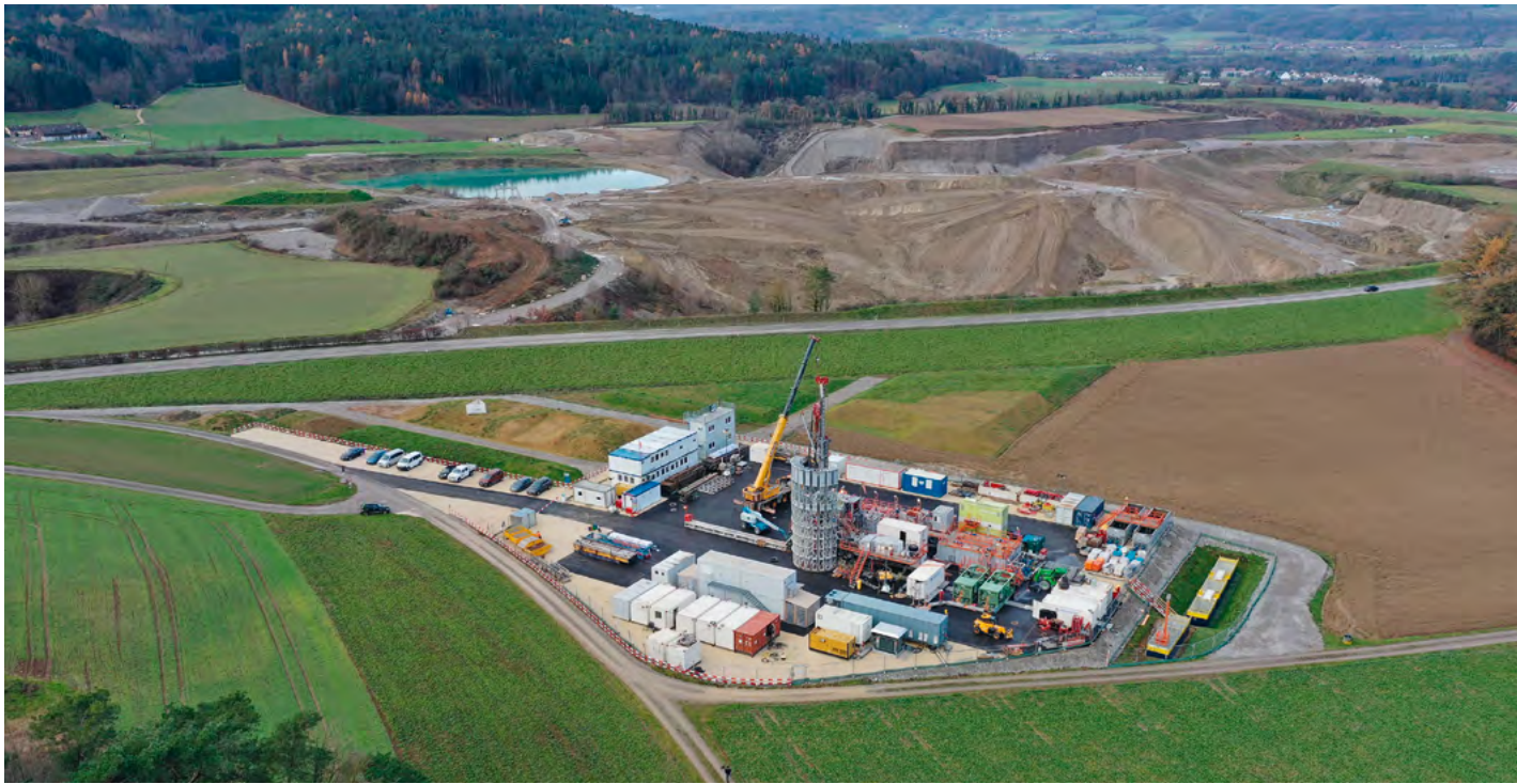
Nagra Bohrplatz Stadel 3.

zeitliche Zielvorgabe wurde leicht abgeändert. Nunmehr heißt es: Die Festlegung des Standortes wird für das Jahr 2031 angestrebt. Die neue Formulierung ist also etwas vorsichtiger gehalten und lässt mehr Raum für eine Nichterreichung dieses Ziels.