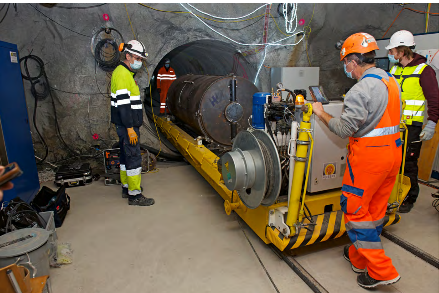
Arbeiten im Felslabor Mont Terri.