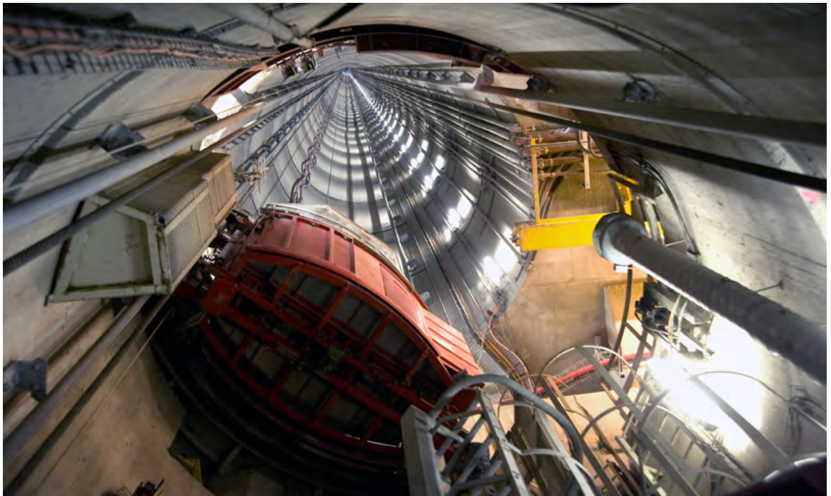
Untertagelabor Andra, Schacht, Départements Marne/Haute Meuse.

Für beide Varianten werden in der Phase III zusätzlich 4 Jahre für die Tätigkeiten des BASE sowie 1 Jahr für die des Gesetzgebers unterstellt. Zeiten für NBG oder Rücksprünge werden nicht berücksichtigt. Dies führt zu einem Zeitbedarf für die untertägige Erkundung von 28 Jahren.