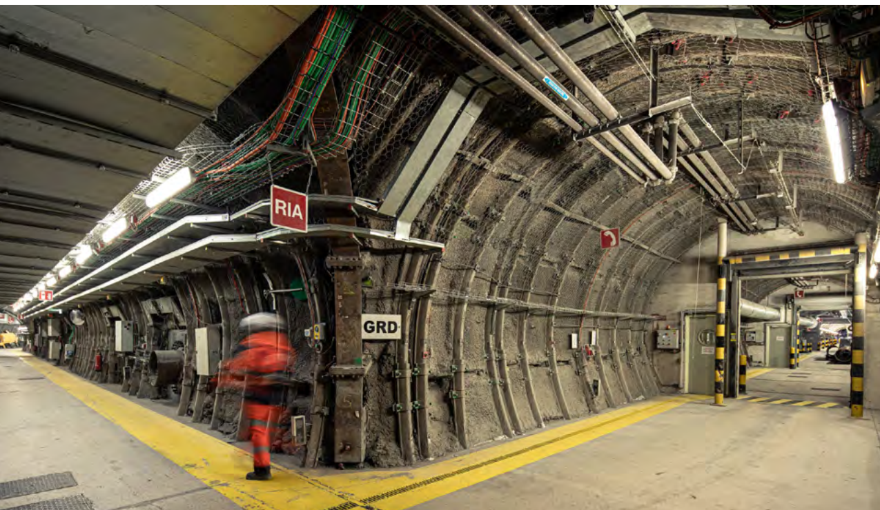
| Eingang des Forschungs- und Entwicklungstunnels des Untertagelabors der Andra, Départements Marne/Haute Meuse.

Dieser liegt aber keine Planung oder Abschätzung zugrunde und stellt somit lediglich eine Zielvorstellung dar. Die vom BMUV genannte Zielvorstellung