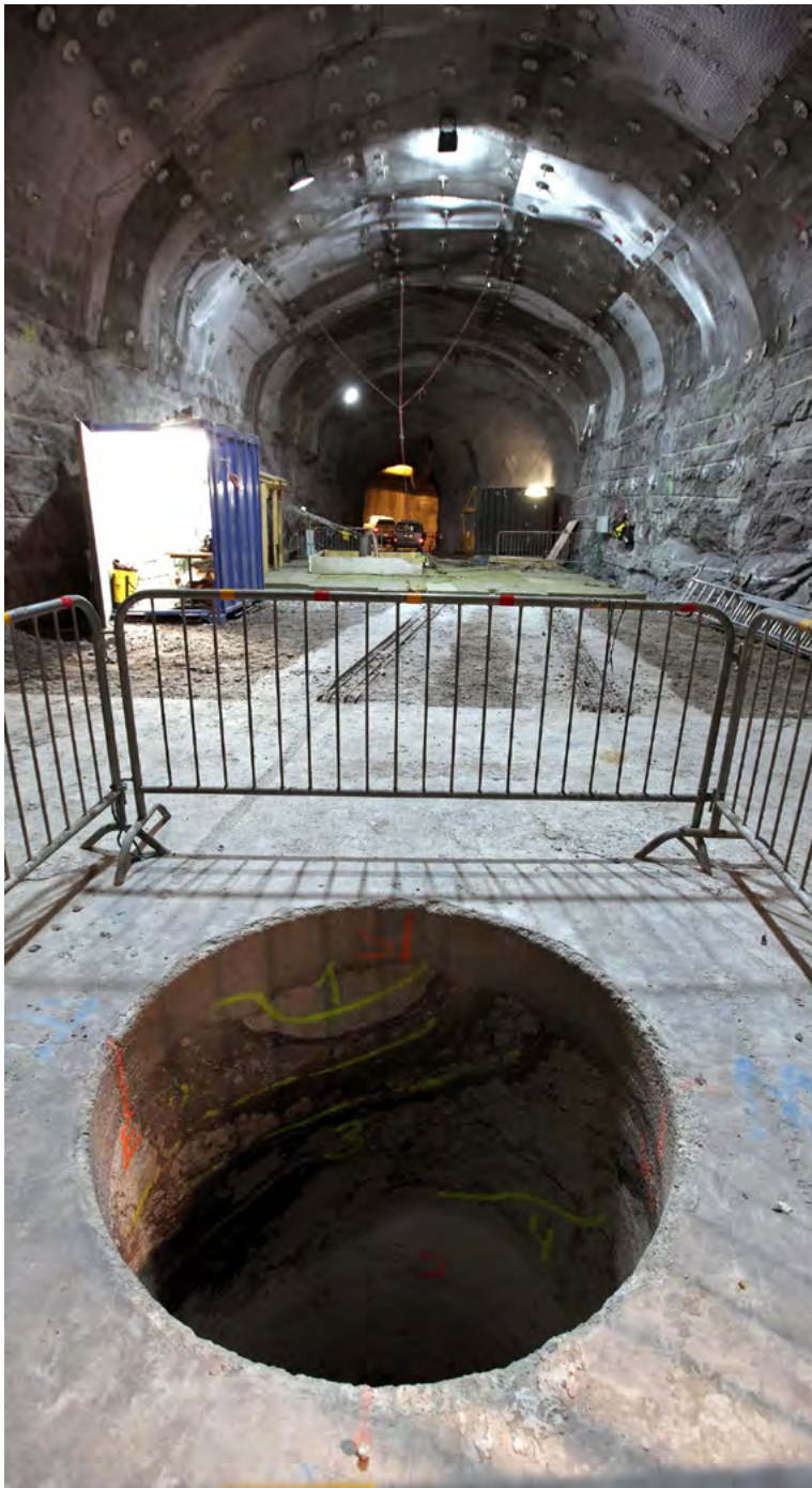
ONKALO Demo Bohrloch für Lagerkanister.

beträgt ohne weitere Detaillierung 20 Jahre nach Festlegung des Endlagerstandorts bis zur Inbetriebnahme. Dies würde dann zu einer Aufnahme des Endlagerbetriebs frühestens im Jahre 2099 führen.